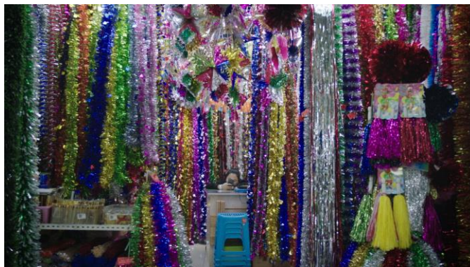
Mika Rottenberg, 《星際發電機》, 2017, 單頻錄像裝置(有聲、彩色), 26 分鐘 36 秒