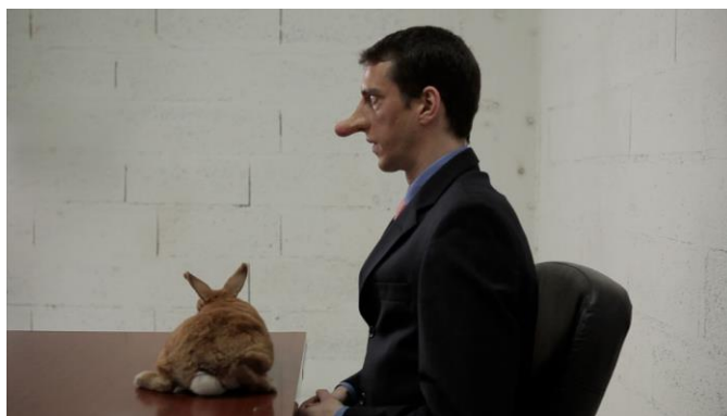
Mika Rottenberg · 《乞嗆》· 2012 · 單頻錄像裝置(有聲、彩色) · 3 分鐘 2 秒