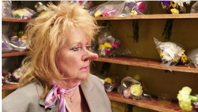
Mika Rottenberg · 《沒有鼻子知道》 · 2015 · 單頻錄像裝置(有聲、彩色) · 21 分鐘 58 秒

© Mika Rottenberg | 鳴謝 Mike and Kaitlyn Krieger 收藏